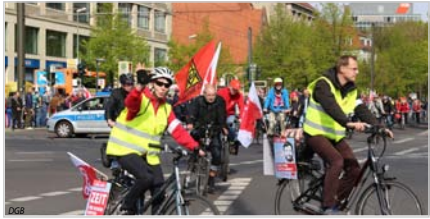
Abb. 1: DGB und ADFC Berlin führen in diesem Jahr gemeinsam zu Orten von gewerkschafts-, stadt- und verkehrspolitischen Bedeutung.