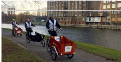
Abb. 2: Lastenräder können das Platzproblem in der Stadt lindern, indem sie Autos ersetzen.