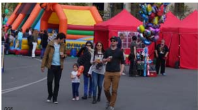
Abb. 4: Der Fahrrad-Korso endet am Mai-Fest vor dem Brandenburger Tor, wo Essensstände, Familienprogramm und Musik zum Feiern einladen.