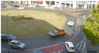
Abb. 3: Die "Vision Zero" - keine Verkehrstoten - erfordert beherrzte Verkehrspolitik an Knotenpunkten wie dem Moritzplatz und eine gerechte Neuaufteilung des Platzes in der Stadt.