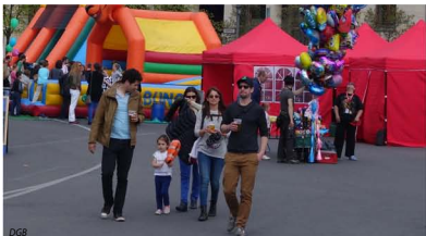
Abb. 4: Der Fahrrad-Korso endet am Mai-Fest vor dem Brandenburger Tor, wo Essensstände, Familienprogramm und Musik zum Feiern einladen.