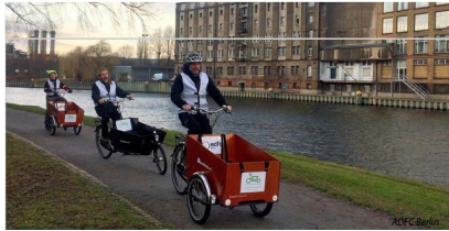
Abb. 2: Lastenräder können das Platzproblem in der Stadt lindern, indem sie Autos ersetzen.