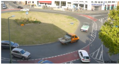
Abb. 3: Die "Vision Zero" - keine Verkehrstoten - erfordert beherrzte Verkehrspolitik an Knotenpunkten wie dem Moritzplatz und eine gerechte Neuaufteilung des Platzes in der Stadt.