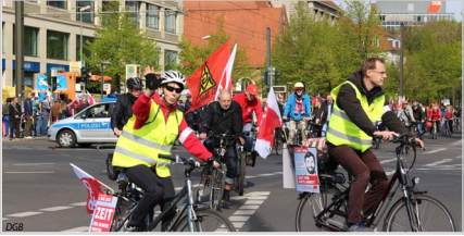
Abb. 1: DGB und ADFC Berlin führen in diesem Jahr gemeinsam zu Orten von gewerkschafts-, stadt- und verkehrspolitischen Bedeutung.